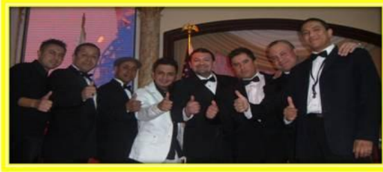
La Orquesta Grande de New York