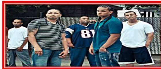
Hip Hop - High Tower hailing