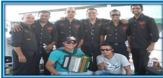
Orquesta Unión de Oro