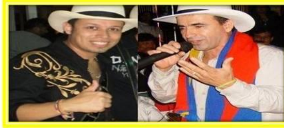
Trobas y musica de despecho