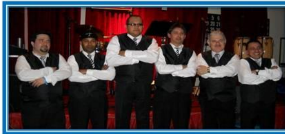
Grupo Ritmo Sabor y mas